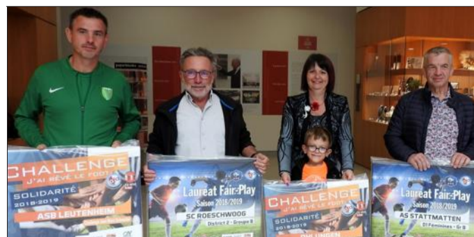
L'ASB Leutenheim, le SC Roeschwoog, l'AS Ohlungen et l'AS Stattmatten figurent parmi les clubs récompensés à Erstein.

Les douze équipes du secteur, dont quatre se sont hissées sur la plus haute marche du podium (US Forstheim/Laubach, SC Roeschwoog, AS Stattmatten, AS Wahlenheim/Bernolsheim), primées récemment dans l'amphithéâtre du musée Würth à Erstein, pour le bon comportement de l'une ou plusieurs de leurs équipes seniors, se sont vues attribuer une dotation financière de 500 € et, pour les lauréats de chaque division, un jeu de t-shirts d'échauffement.