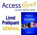
ACCESSGYM GENERAL Livret du pratiquant - Edition 2016/2017