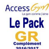
Access Gym GR Général - complément 2016/2017