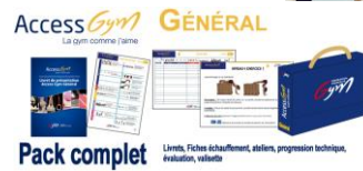
Access Gym GENERAL - Edition 2016-2017