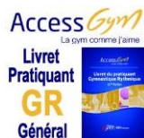
ACCESSGYM GR Livret du pratiquant - édition 2016/2017