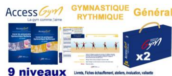
Access Gym GR Général - édition 2016/2017