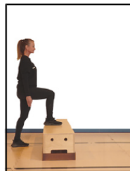
Basic step sur support