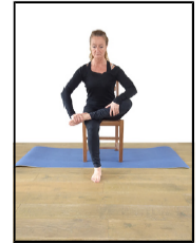
Etirement fessiers assis