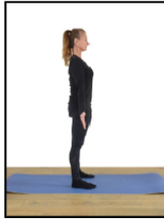
Debout pieds parallèles largeur bassin