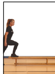
Montée et descente sur petite poutre sans envol