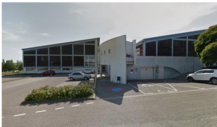
Accueil clubs et entrée gymnastes/officiels