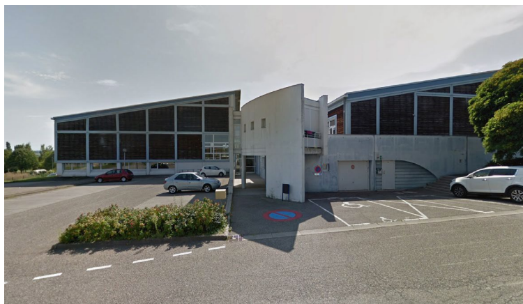
Accueil clubs et entrée gymnastes/officiels