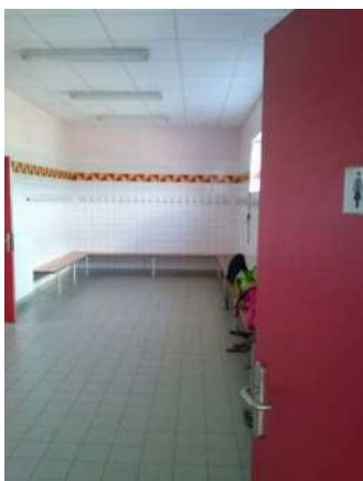
Vestiaire des filles